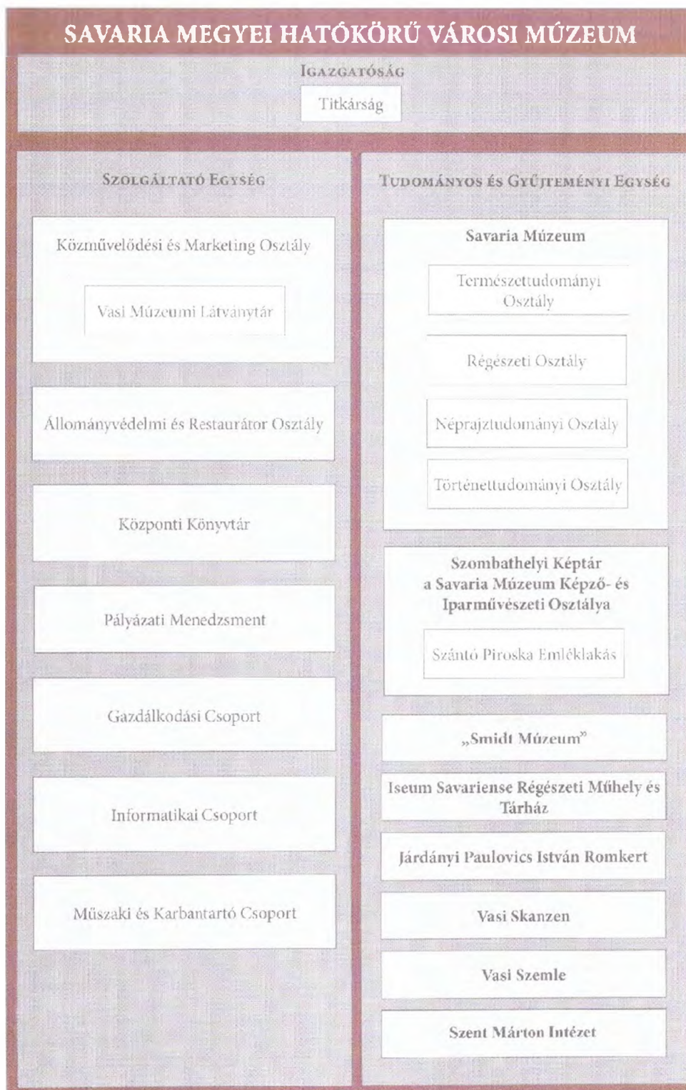
1. ábra: A Savaria Megyei Hatókörű Városi Múzeum szervezeti fő- és alegységei